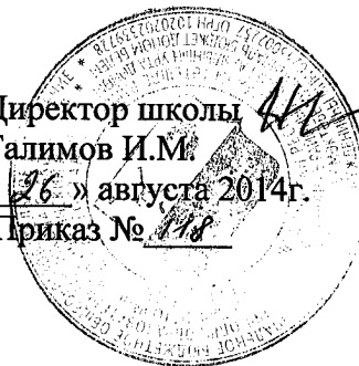
График проверки классных журналов, журналов факультативных занятий, внеурочной деятельности